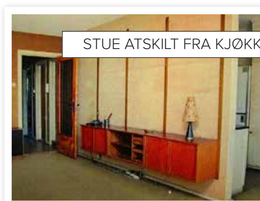
STUE ATSKILT FRA KJØKKEN

Ny planløsning. Gangen ble forstørret og soverommet krympet. Passasjen mellom bad og kjøkken ble stengt, og stue og kjøkken ble smeltet sammen.