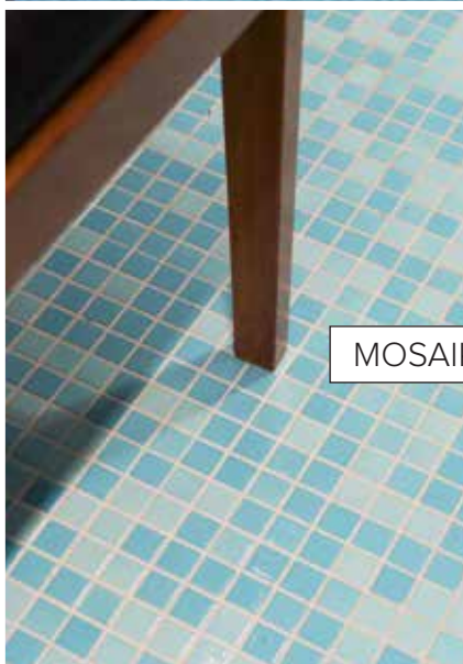
MOSAIKK PÅ GULVET