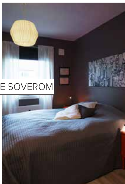
LITT MINDRE SOVEROM