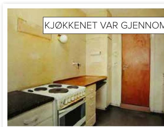
KJØKKENET VAR GJENNOMGANGSAREAL