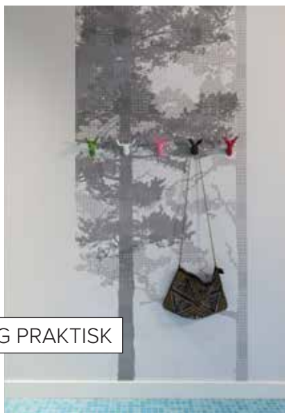
LEKENT OG PRAKTISK