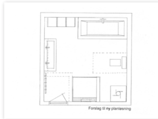
Forslag til ny planløsning

Opprinnelig plan. Gangen utenfor badet var rommelig og familien hadde anledning til å ta en kvadratmeter derfra. Det var lite skaplass, og trangt ved vasken og dusjen.