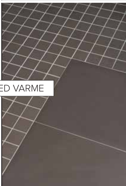
FLISER MED VARME

Glasshyllen oppå de vegghengte skapene er praktisk og dekorativ. Skap fra Villeroy & Boch.