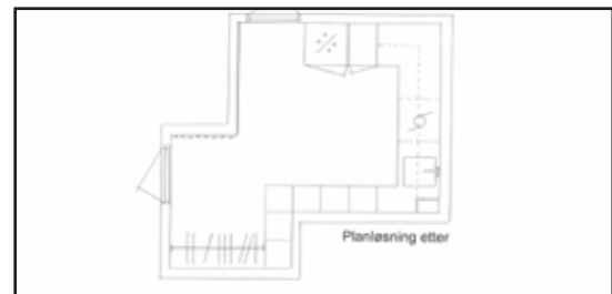
Ny planløsning. 1,36 kvm av garasjen ble innlemmet i vaskerommet, lite, men helt nødvendig.