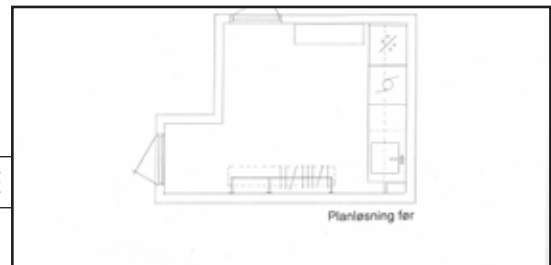
Tidligere løsning. Før utvidelsen var rommet 8,5 kvm.